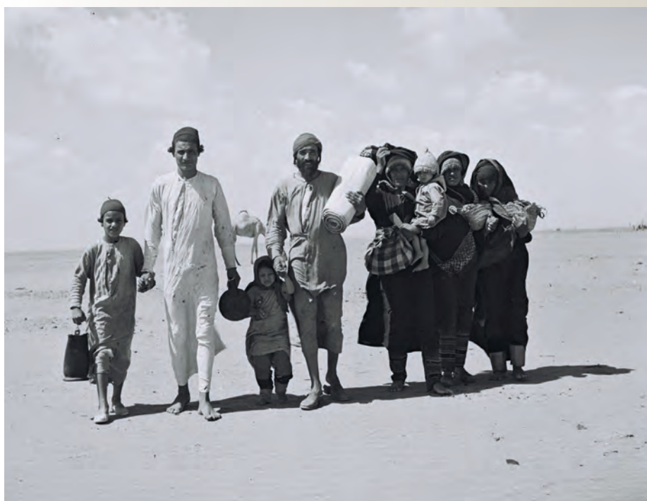
Rodzina jemenickich Żydów zdążająca do obozu przesiedleńczego JOINT w pobliżu Adenu